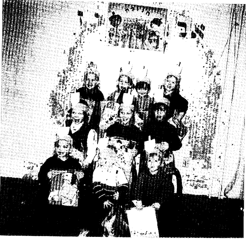
מסיבת חנוכה לילדי חמד בק"ק הארטלי