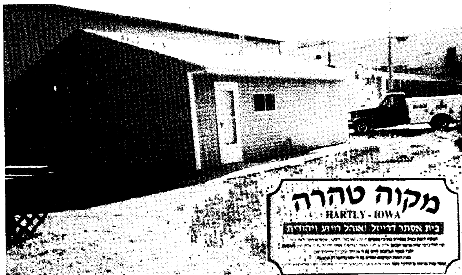
מקוה טהרה לנשים