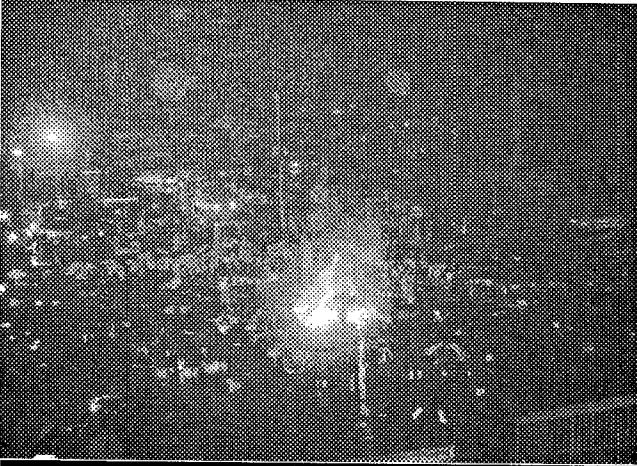
א בילד פון אויבן פון די קידוש השם, מוצש"ק