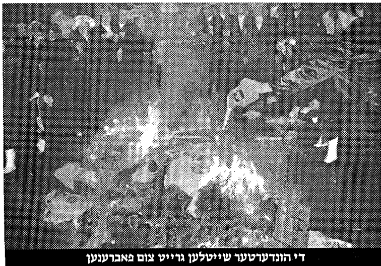
די הונדערטער שייטלעך גרייט צום פארברענען

דער רב שליט"א האט שוין מגלה געווען זיין דעת תורה אין א מכתב קודש וואס ער האט שוין מפרסם געווען אינאיינעם מיטן דיין שליט"א פארגאנגענעם