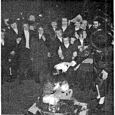
ביים אנהייב פונעם מדורה